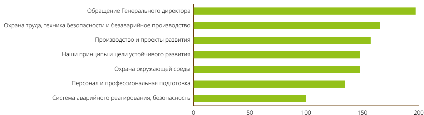
Граф. 1. Наиболее востребованные разделы отчета

В рамках работы над подготовкой данного Отчета, мы видим своей основной целью постоянно повышать осведомленность общественности о значимых темах, раскрываемых в Отчете. В бумажных вариантах наших Отчетов есть отрывные формы обратной связи для заполнения читателями. Онлайн-форма обратной связи размещена на нашем веб-сайте , кроме того мы всегда открыты для получения обратной связи по отчету в произвольной форме через ящик Sustainability@kpo.kz . Поступившие замечания и предложения учитываются при подготовке очередного отчета.