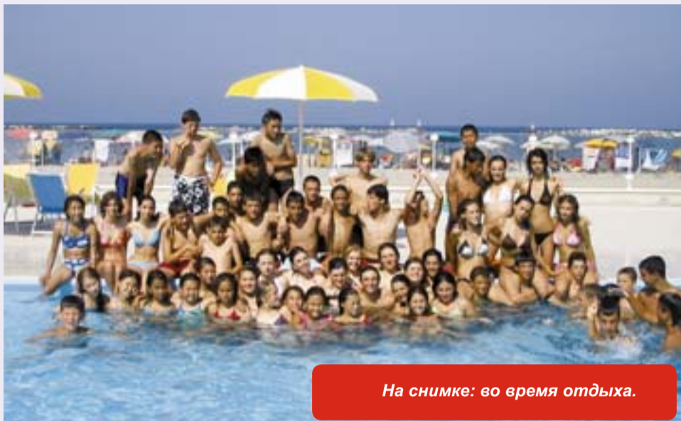
На снимке: во время отдыха.

Чезенатико - современный оживленный город, пользующийся славой одного из самых знаменитых курортов на Адриатике. На протяжении многих веков Чезенатико развивался как морской центр, жители которого занимались рыбной ловлей и торговлей. До сих пор средоточием жизни города является портовый канал, носящий