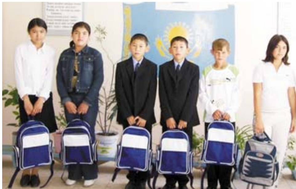
На снимке: дети с подарками.

С пожеланиями успехов в новом учебном году мы про-