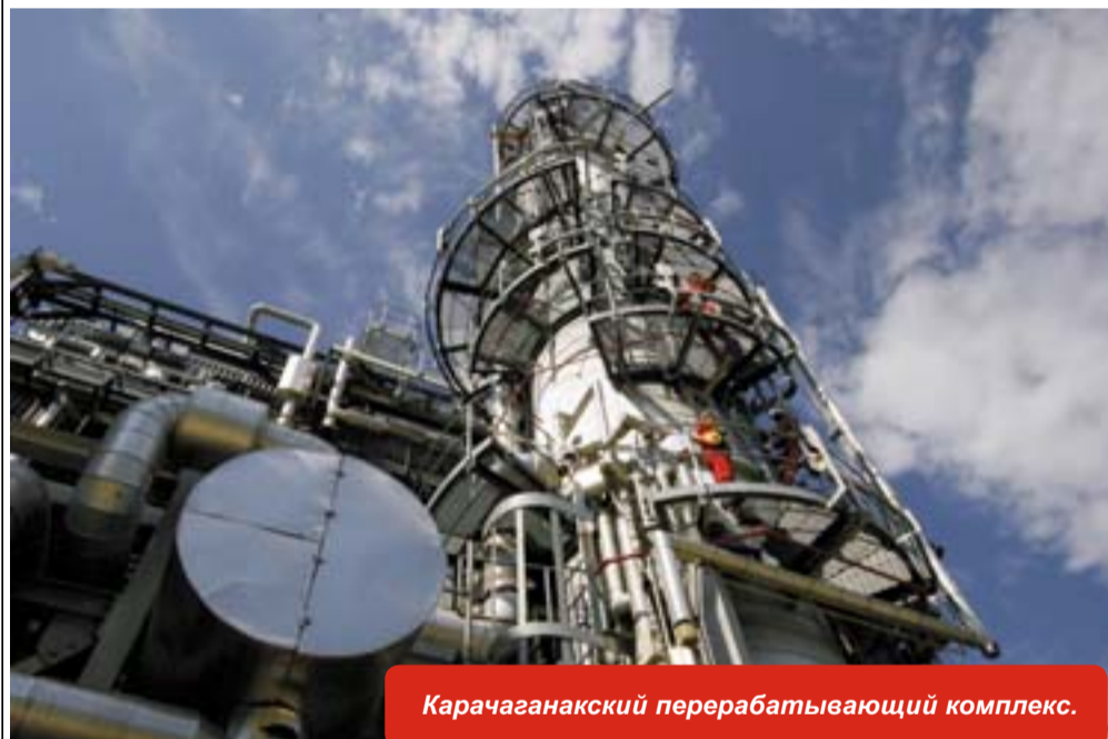
Карачаганакский перерабатывающий комплекс.

Компания «Карачаганак Петролиум Оперейтинг» Б.В. (КПО) провела ежегодный планово-профилактический ремонт. В ходе пятимесячной программы, начатой в середине мая и завершенной в начале октября, КПО осуществила техобслуживание, модернизацию и необходимый ремонт технологического оборудования производственных объектов, расположенных на Карачаганакском месторождении, включая Карачаганакский перерабатывающий комплекс (КПК) и установки комплексной переработки газа - ГП-2 и ГП-3.