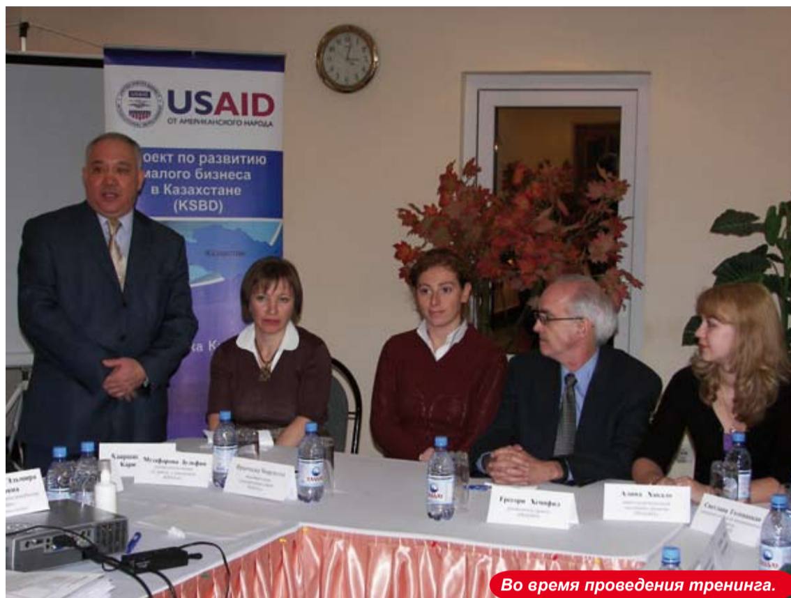
Во время проведения тренинга.

вать на хлеб. А потому инвесторы серьезно продумали вопрос обучения начинающих предпринимателей и переквалификации безработных. В числе реализованных проектов, направленных на становление среднего и малого бизнеса, организованных объединенными усилиями КПО и Западно-Казахстанской областной ассоциации предпринимателей «Даму» - открытие «Бизнес-инкубатора» для того, чтобы создать наиболее благоприятные условия тем, кто решил открыть собственное дело. И это было только на начальном этапе. В «Бизнес-инкубаторе» находили активную поддержку и сельские жители. КПО выделены кредитные средства для развития предпринимательства