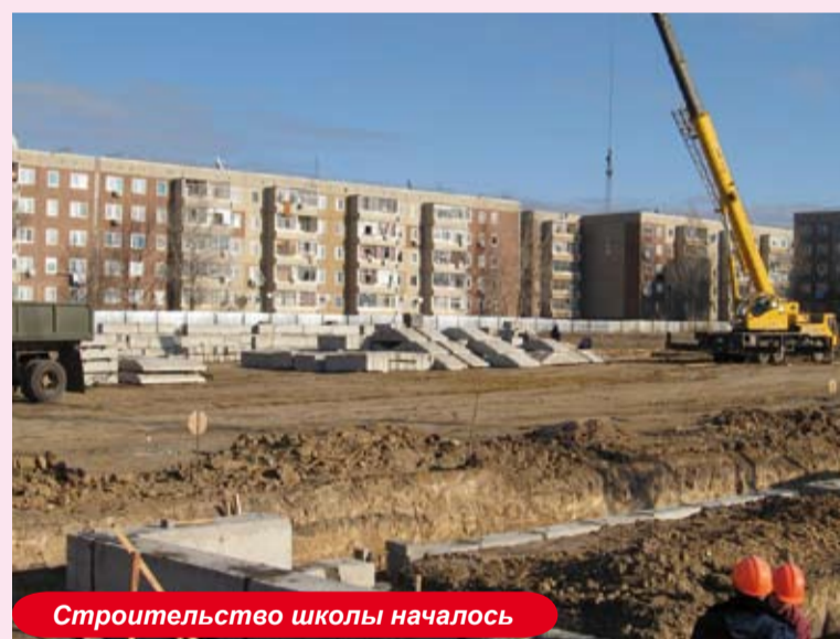
Строительство школы началось

Строительство школы началось в октябре этого года и предполагаемый срок ее завершения — октябрь следующего года. Строительные работы производит местная компания ТОО «Жаиксельстрой», проект подготовило ТОО «Газжобалау», а заказчиком является компания КПО. Общий бюджет строительства школы составляет 8 миллионов долларов. Согласно плану, школа будет трёхэтажной и рассчитана на 36 классов-комплектов. Предполагается, что школа сможет вместить 900 учащихся. В школе будут действовать 2 спортивных зала, столовая на 328 мест, мультимедийные классы, оснащенные более чем 70 компьютерами, стрелковый тир, физио и зубной кабинеты, душевые, актовый