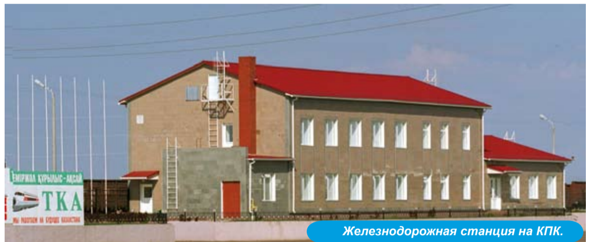
Железнодорожная станция на КПК.

- Что касается общественно-социальной жизни района – наша компания принимает в ней самое активное участие, перечисляя часть своих средств на благотвори-