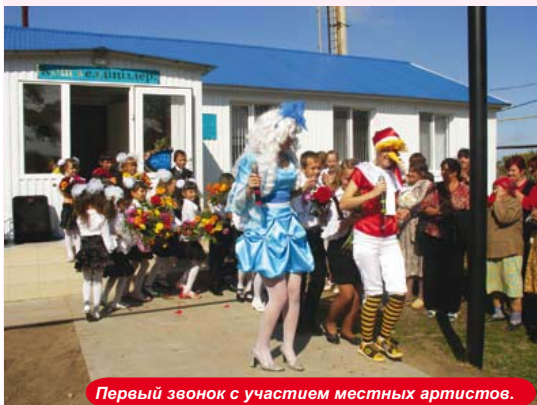
Первый звонок с участием местных артистов.

Трудно переоценить значение участия предпринимательства в социальных проектах, имеющих прямое отношение к улучшению качества жизни и поддержке детства. Отрадно, что в этом направлении у местного населения с КПО сложились долгосрочные отношения сотрудничества и взаимопонимания.