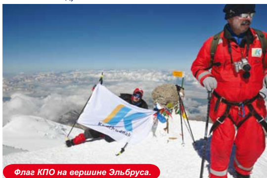
Флаг КПО на вершине Эльбруса.

Компания КПО и Аксайский лыжный клуб гордятся и поздравляют покорителей высочайшей европейской горной вершины! Это достижение - показатель прекрасной физической подготовки, выносливости и силы духа наших коллег.