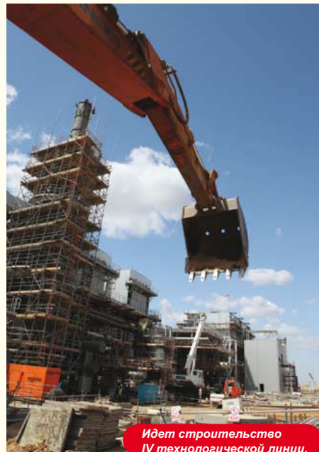
Идет строительство IV технологической линии.

- Это еще один крупный проект, помимо Карачаганакского. Разработкой Чинаревского месторождения занята компания «Жайыкмунай». Как подсчитано, за год добыча природного газа составит от 1,5 млрд. до 3 млрд. кубометров, сжиженного газа - от 125000 до 250000 тонн. По условиям меморандума о поставке удежленного газа на строящуюся электростанцию, подписанного между акиматом области и «Жайыкмунаем», цена газа составит всего 29,5 доллара за тысячу кубометров. Если благодаря Карачаганакскому проекту строятся все газопроводы, то «Жайыкмунай» также в перспективе обеспечит большой объем работ.