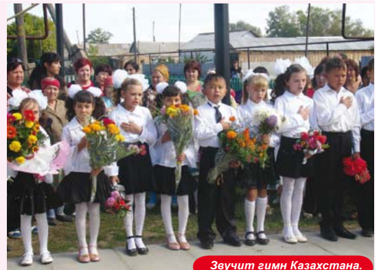
Звучит гимн Казахстана.

- Сегодня народ Казахстана отмечает праздник - День Знаний. В любом государстве образование и воспитание детей входит в число главных задач, стоящих перед обществом, поэтому качество образования включено в перечень приоритетных целей стратегии «Казахстан -2030», где главным критерием успешности образования является достижение такого уровня, когда каждый из получивших специальность и квалификацию, сможет стать востребованным специалистом в любой стране мира. От имени жителей села Димитрово хочется поблагодарить компанию КПО за постоянное внимание и заботу, а также участие во многих социальных проектах нашего и других сельских округов. Особо необходимо отметить, что большое внимание