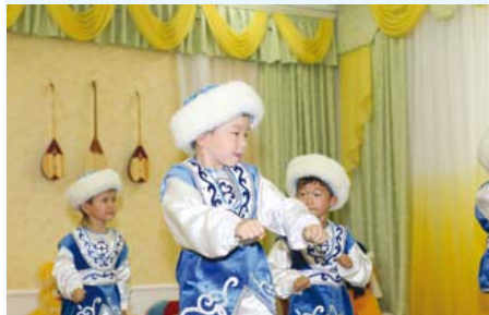
Выступают воспитанники детского сада.

Здание детского сада, в самом деле, поражает своей красотой и масштабностью, что с большим удовольствием было отмечено г-ном Измухамбетовым, который в своей речи, обращаясь к присутствующим, отметил, что