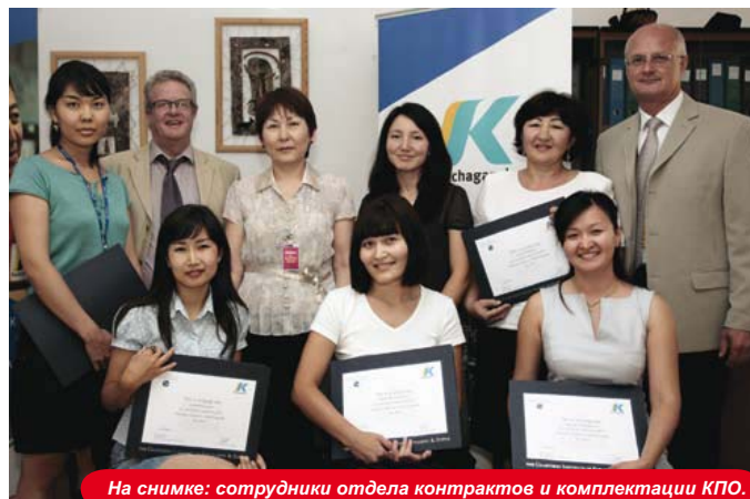
На снимке: сотрудники отдела контрактов и комплектации КПО.

Эта программа обучения, инициированная компанией КПО, предоставлена Британским институтом по закупкам и снабжению в рамках развития профессиональных навыков у местного персонала.