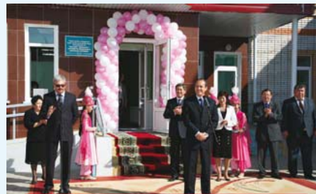
Во время церемонии открытия детского сада.

Кроме того, хотелось бы добавить, что наше сотрудничество было бы невозможным без поддержки со стороны официальных властей ЗКО, и особенно, без личной