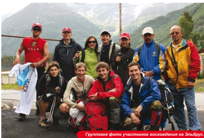
Групповое фото участников восхождения на Эльбрус.