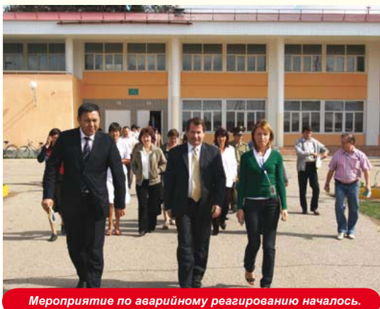
Мероприятие по аварийному реагированию началось.