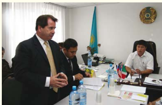
Идет обсуждение в офисе акима села Жарсуат.

Система экологического мониторинга включает в себя оборудование связи и оповещения: Центральную станцию экологического мониторинга (ЦСМ), расположенную в административном офисе месторождения; 12 станций экологического мониторинга (СЭМ), работающих в автоматическом режиме, расположенных в направлении населенных пун-