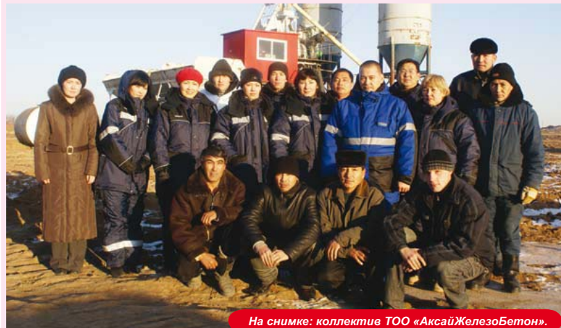
На снимке: коллектив ТОО «Аксай Железобетон».

стандартам. ТОО «Аксай Железобетон» признано одним из ведущих предприятий в регионе. За выдающиеся производственные показатели, а также за эффективность работы по технике безопасности, снижению негативного воздействия на окружающую среду, ТОО «АЖБ» было удостоено специальной награды, символизирующей победу света и качества. В минувшем году предприятие отработало 306 тысяч часов без потерь рабочего времени и происшествий. Были сданы в эксплуатацию станция экологического наблюдения, учебная площадка для персонала КПО, 4 площадки для буровых установок, очистительное сооружение «Лагуна», подъездные дороги к месторождению.