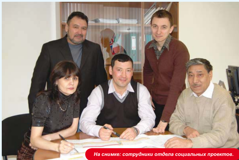
На снимке: сотрудники отдела социальных проектов.

На протяжении многих лет отдел социальных проектов КПО не только активно участвует в социальной жизни региона, но и тесно сотрудничает с ведущими