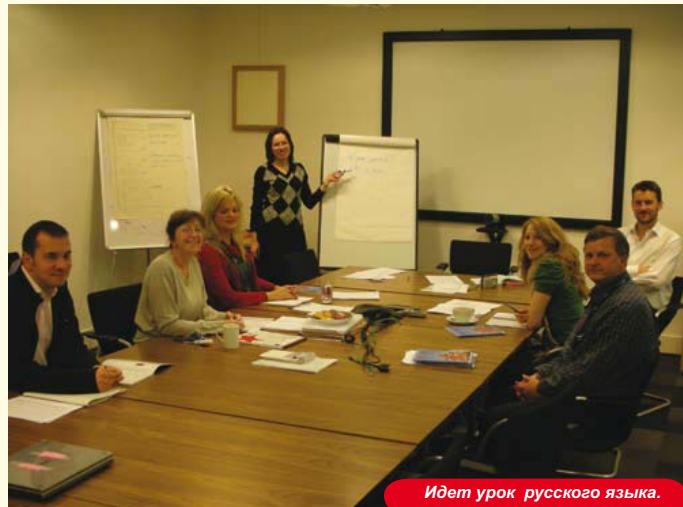
Идет урок русского языка.

язык! Оказалось, что это также отличный способ узнать поближе моих коллег по ДРП.