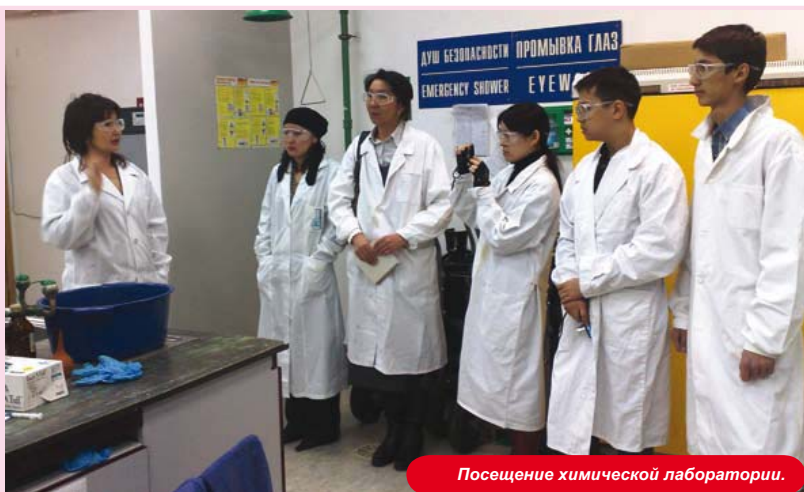
Посещение химической лаборатории.

По словам школьников и их преподавателей, экскурсия на Карачаганакское месторождение была очень полезной и интересной для них. Особенно их поразили масштабы месторождения, а также новейшая технология, применяемая для добычи углеводородов.