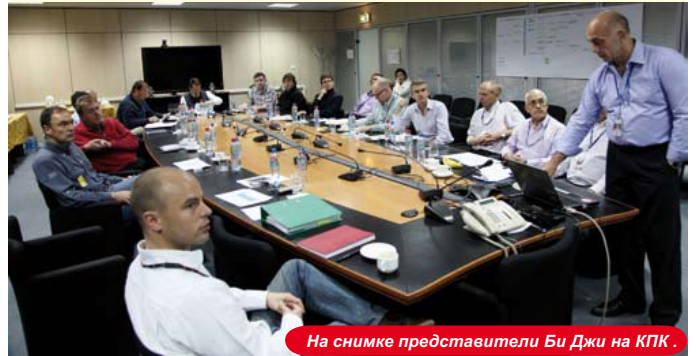
На снимке представители Би Джи на КПК.

В ходе визита представители Би Джи провели ознакомительную экскурсию по промышленным объектам месторождения, посетив Карачаганакский перерабатывающий комплекс (КПК), ГП-2, ГП-3, а также ознакомились с текущим строительством IV технологической линии. Кроме того, высокие гости встретились со своими коллегами, представляющими компанию «Би Джи», которые в настоящее время работают в компании КПО и участвуют в разработке Карачаганакского месторождения.