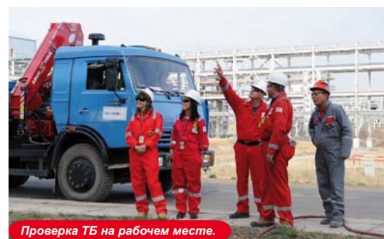
Проверка ТБ на рабочем месте.