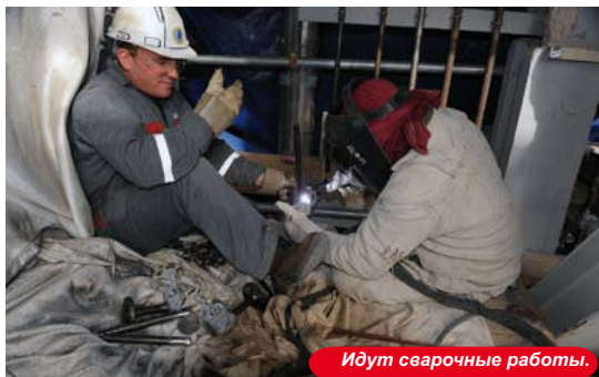
Идут сварочные работы.

В компании КПО техника безопасности лежит в основе любых выполняемых работ и, поэтому всегда будет являться областью повышенного внимания компании. Процесс разработки и эксплуатации такого технически сложного месторождения, как Карачаганакское, требует от каждого работника предприятия и подрядных организаций постоянно помнить о важности соблюдения правил ТБ. Каждому виду нефтегазовых операций присущи угрозы безопасности, а на Карачаганакском месторождении ситуация осложняется такими факторами как резкие колебания экстремальных температур, высокое содержание сероводорода в добываемом и перерабатываемом углеводородном сырье, а также закачка сырого газа в пласт под высоким давлением.