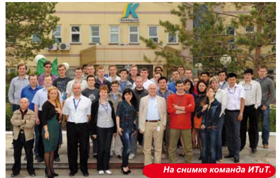
На снимке команда ИТиТ.