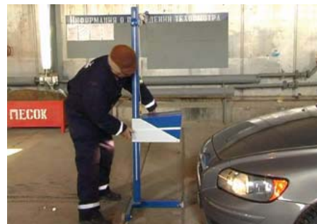
проверяли? – возмущаются водилы. – В нем такого мешано сейчас, что еще удивляться надо – как машина едит?»

Истина где-то рядом – планируя реформу в системе контроля, почему бы его не распространить на действующие АЗС, раз это имеет прямую взаимосвязь с безопасностью и экологией? Всю зиму автолюбители жалуются на нехватку бензина на заявленных 100 км и быстро засоряемые свечи. По сути, в Аксае (а может, и в природе вообще?), нет такой контролирующей организации, которая бы проверяла на заправках качество поставляемого в продажу топлива. Водители предлагают: почему бы во время техосмотра сначала не определять состав содержимого бензобака автомобиля, прежде чем обвинять машину в загазованности?