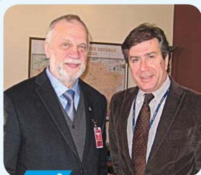
- стр. 3