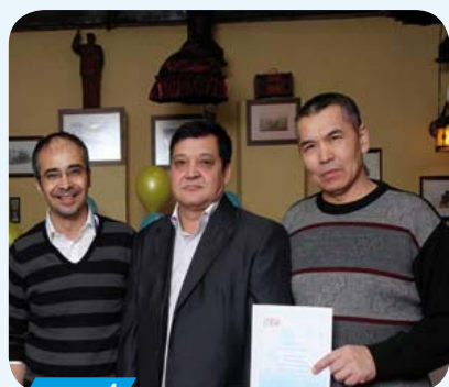
- стр. 4