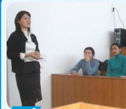
- стр. 5