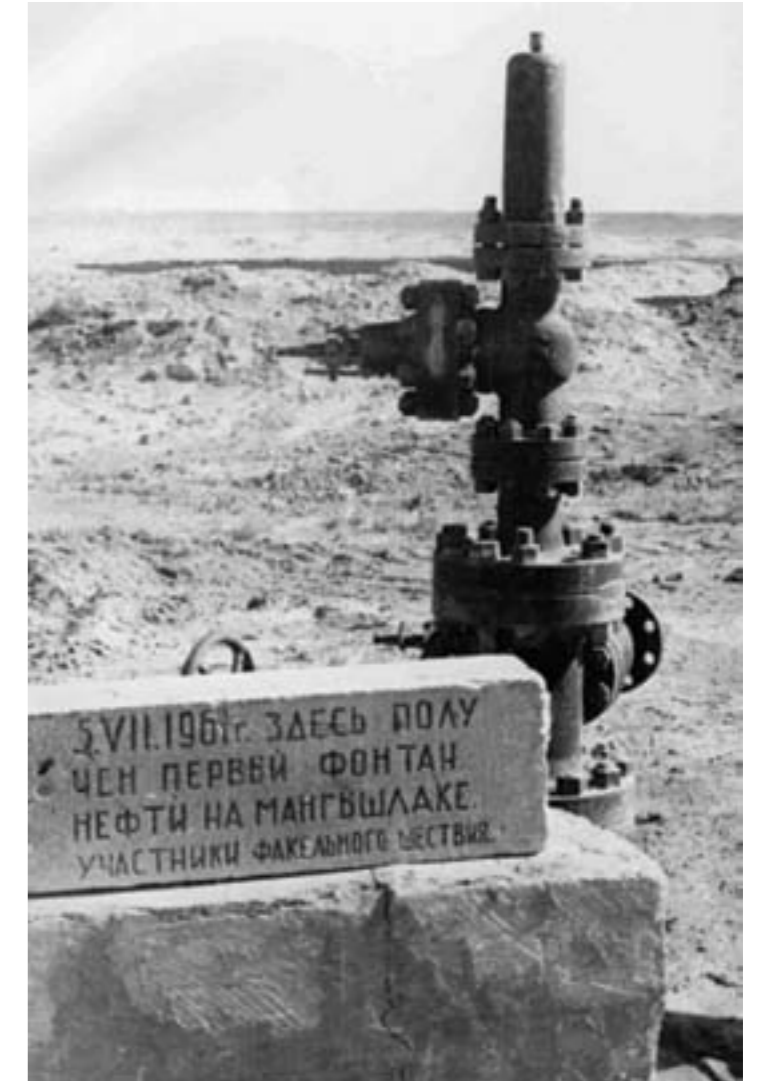
16. Скважина, из которой был получен первый фонтан нефти на Мангышлаке

15. Следующее десятилетие становится новым витком в истории освоения казахстанской нефти. Ударными темпами ведется разведка на полуострове Мангышлак. Планомерно, километр за километром, изучается и пробуривается его южный район, идет усиленный поиск новых месторождений