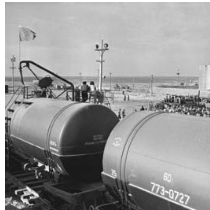
24. В 1965 году на Гурьевский нефтеперерабатывающий завод отправляется первый эшелон мангышлакской нефти. Добыча нефти в Казахстане достигает уровня 2 млн тонн в год