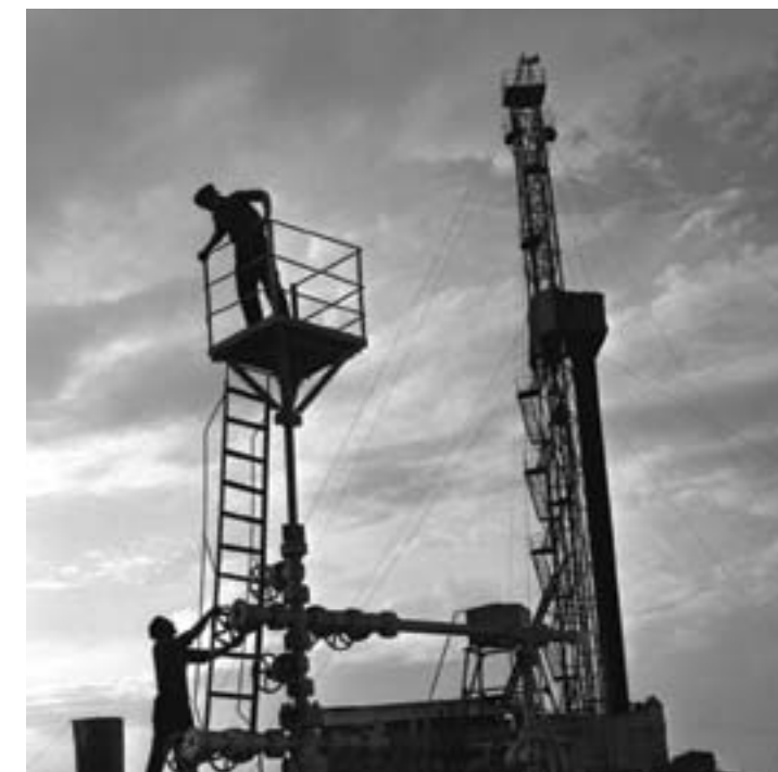
25. После открытия крупнейших месторождений на юге Мангышлака Узень и Жетыбай - разведанные запасы нефти увеличились в 20 раз, а годовая добыча - в 14 раз. К 1969 году добыча нефти в Казахстане составляет более 10 млн тонн в год