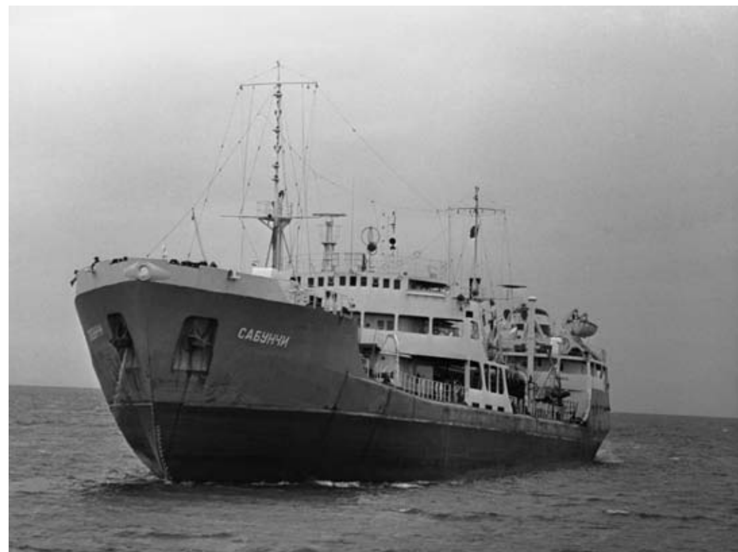
26. Танкер "Сабунчи" на Каспийском море