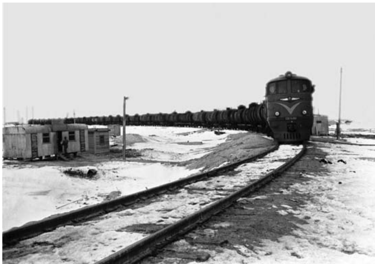
23. Трехтысячный состав с мангышлакской нефтью, 1969 г.