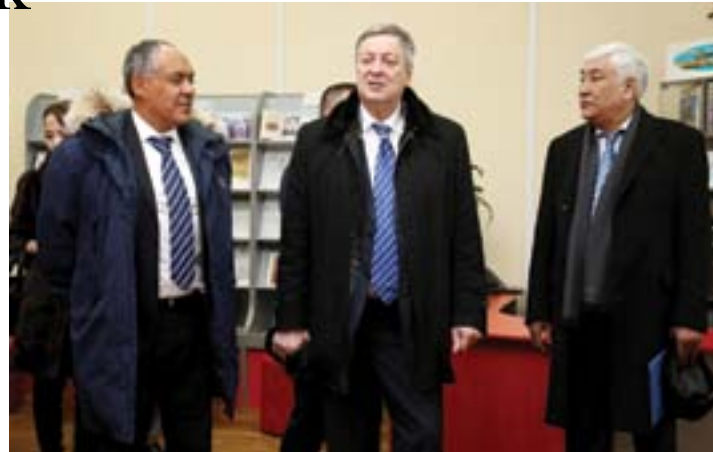
Karachaganak Oil and Gas Field development."