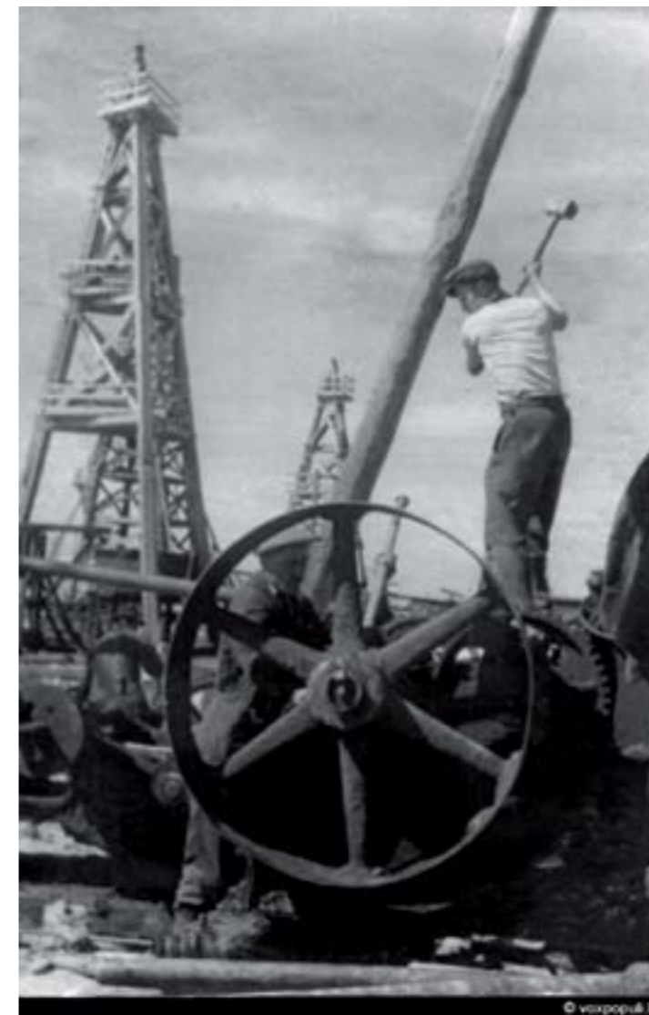
4. Общий вид нефтепромысла Доссор.

3. В 30-е годы начинается бурное развитие Гурьевской области. Создаются лаборатории, открывается нефтяной техникум, образуется контора "Эмбанефтепроект". В июне 1932 года начинается строительство нефтепровода Гурьев-Эмба-Орск. Открываются новые месторождения: Байчунас, Косчагыл, Шубаркудук, Кульсары.